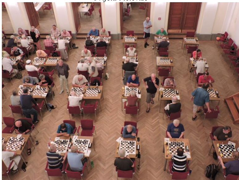
Pohled ze shora!