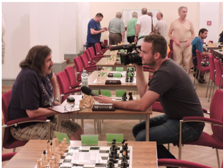
Přijela i televize