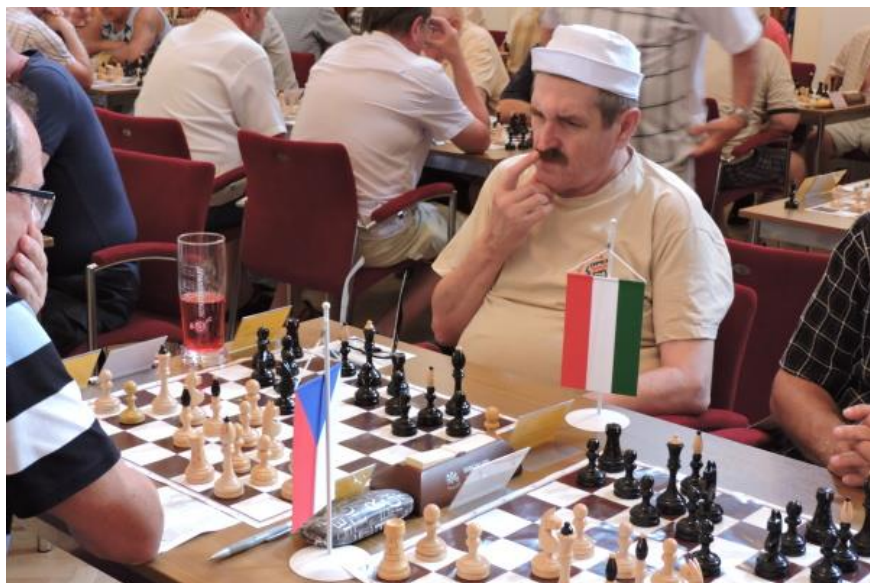
To byl ale dobrý tah!