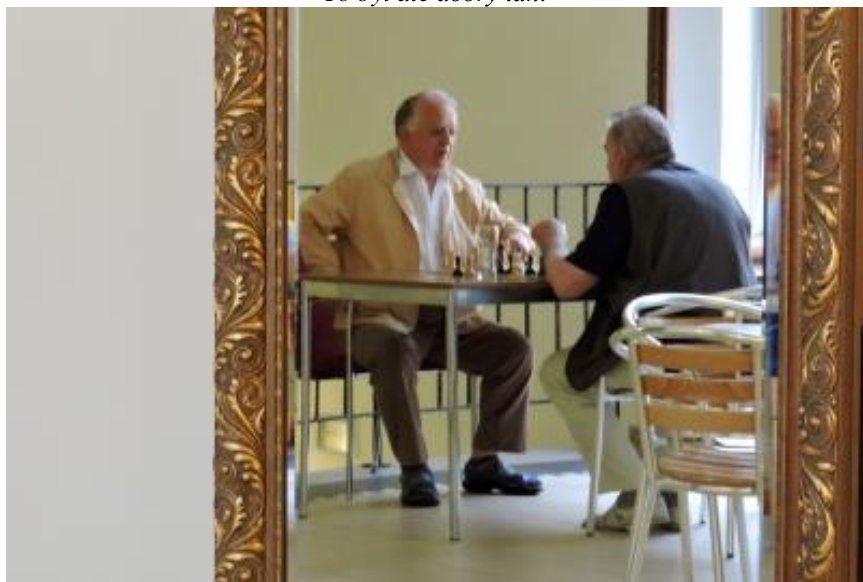
I v Rychnově jsou paparazzi!