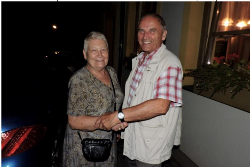
A všichni při čekání na minibus odjžděli spokojení!