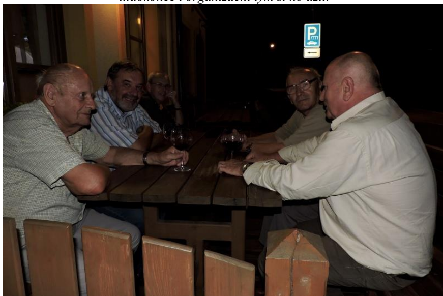
Posezení bylo venku...