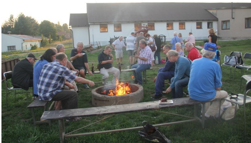
A vše bylo zakončeno společným „táborákem“ ...