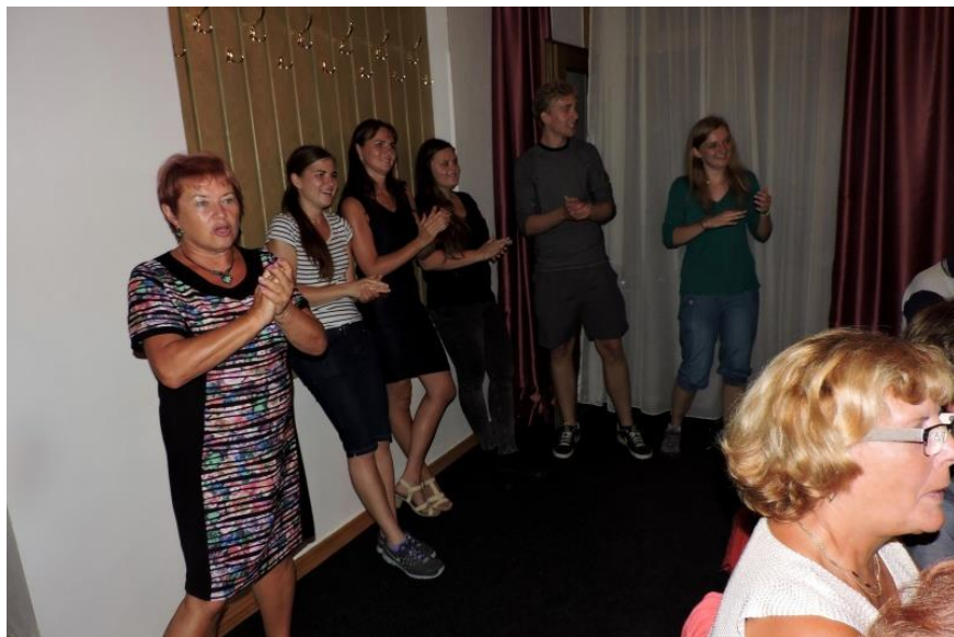
...dokonce i organizační tým si ho užil.