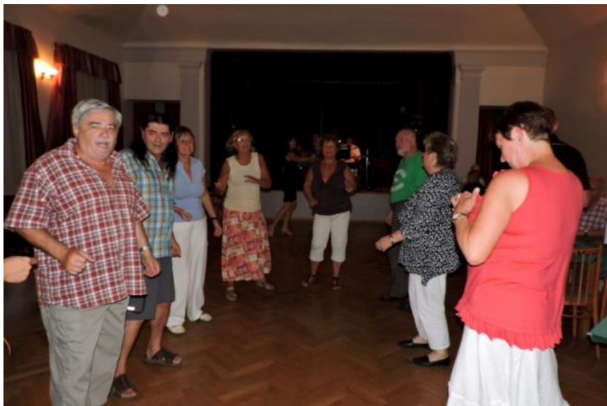
Nakonec se na parketu ukázali téměř všichni účastníci zábavy v Lupenici...