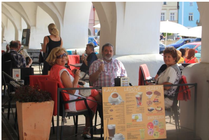
Zmrzlina je výborná.