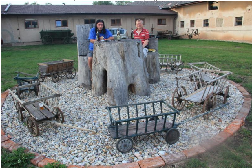
...s originálním posezením.