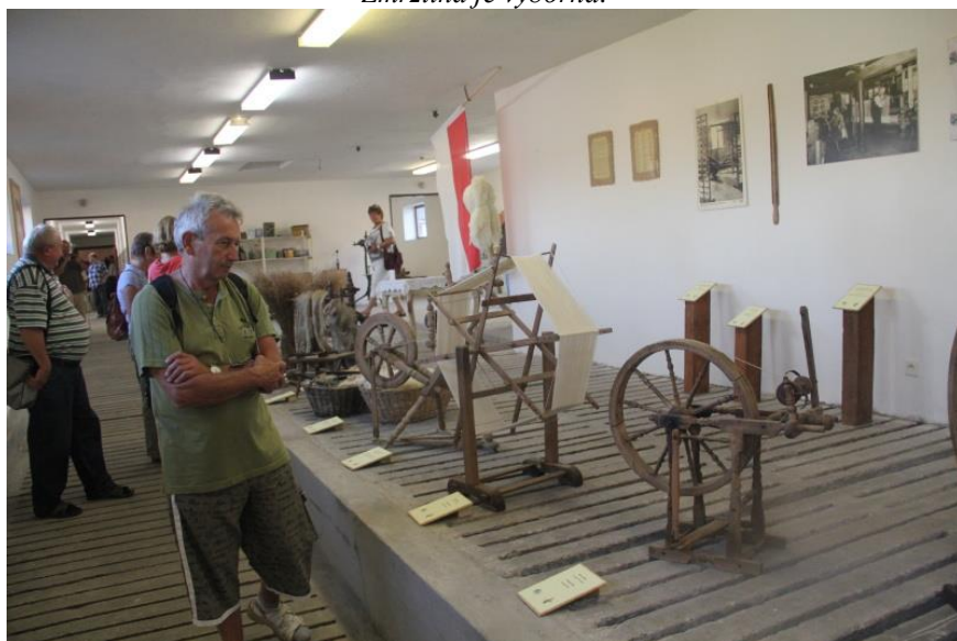
Jako již každý rok se mnoho účastníků vydalo poznávat krásy Čech při společném výletu.