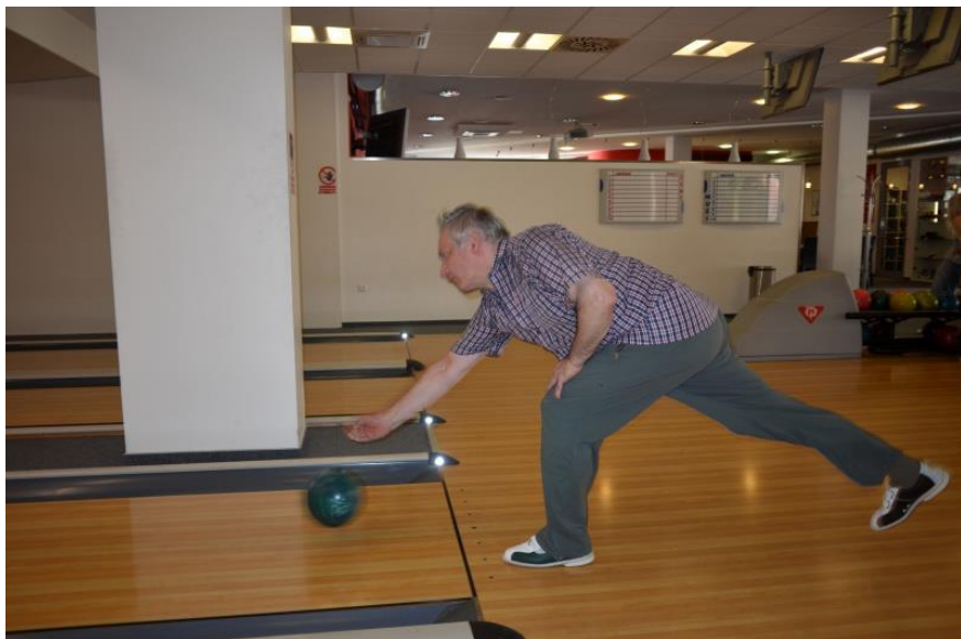
I na bowling se našel čas.