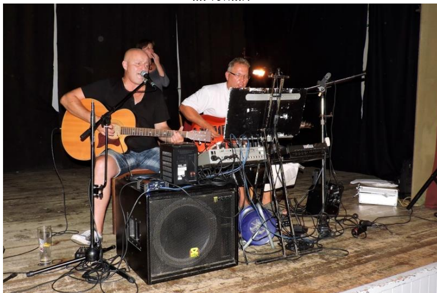
Kapela hrála výborně!