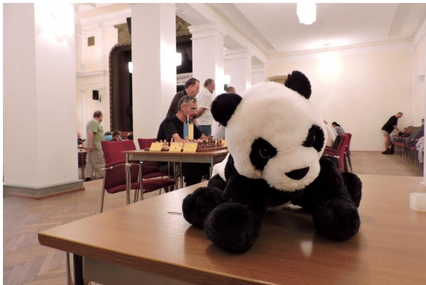
Nová Panda, ale musí ještě vyrůst...