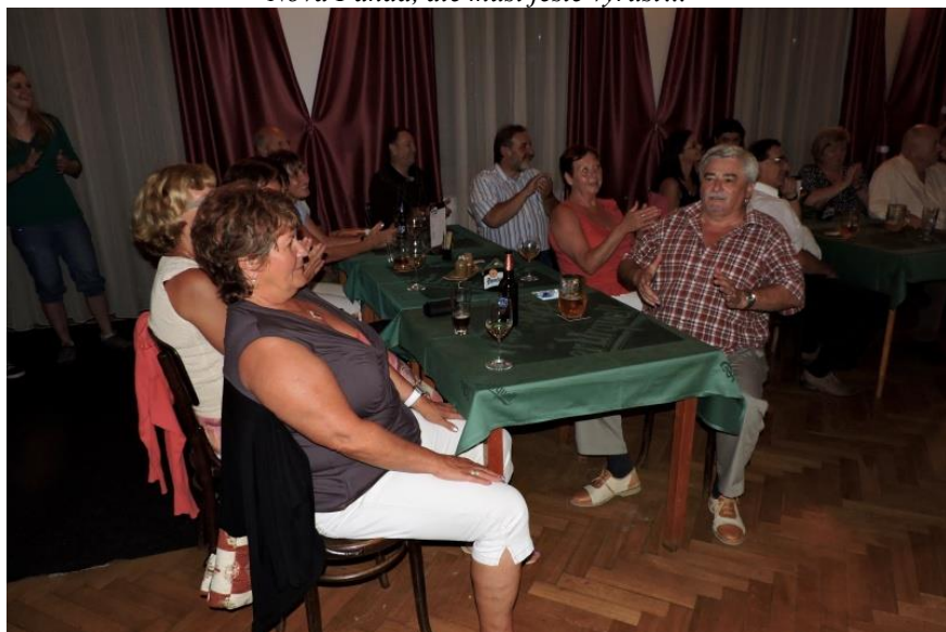
Ohlédnutí za společenským večerem...všichni určitě byli s řízkem a zábavou spokojeni...